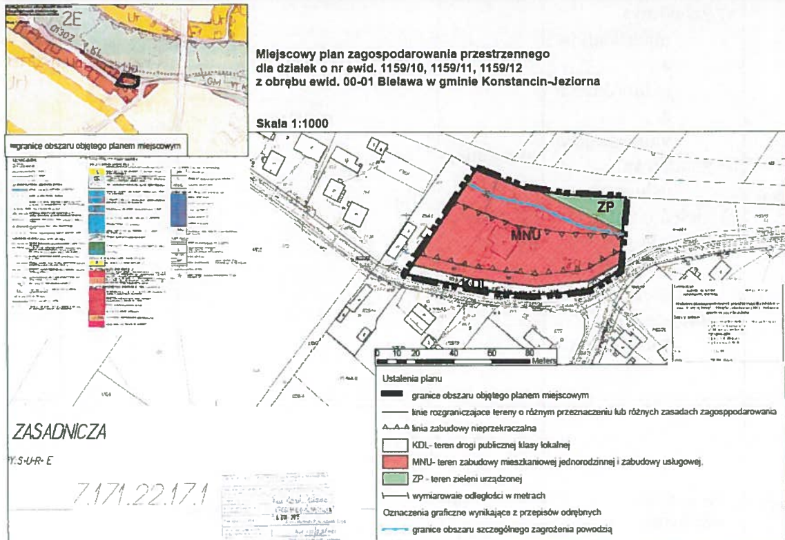
Rycina 2. Rysunek projektu miejscowego planu zagospodarowania przestrzennego dla działek o nr ewid. 1159/10, 1159/11, 1159/12 z obrębu ewid. 00-01 Bielawa w gminie Konstancin-Jeziorna (opracowanie własne).

Realizacji głównych celów miejscowego planu zagospodarowania przestrzennego służyć mają następujące ustalenia: