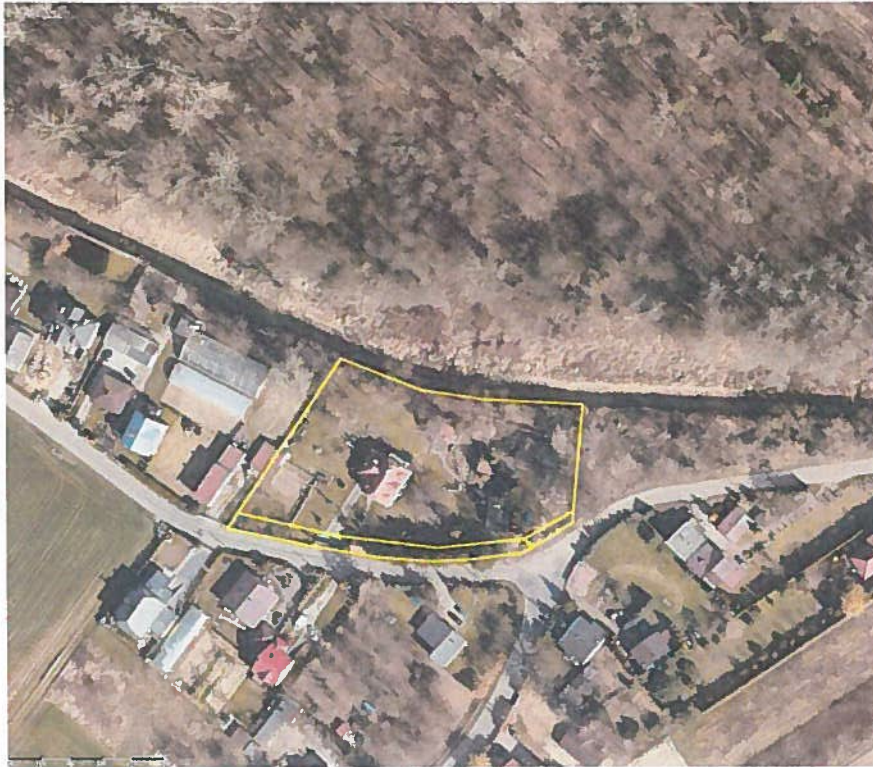
Rycina 1. Obszar opracowania projektu miejscowego planu zagospodarowania przestrzennego dla działek o nr ewid. 1159/10, 1159/11, 1159/12 z obrębu ewid. 00-01 Bielawa w gminie Konstancin-Jeziorna (opracowanie własne).