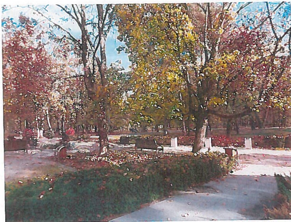
Rysunek 5. Park Zdrojowy im. Hrabiego Witolda Skórzewskiego

Jeszcze po II wojnie światowej do parku dojeżdżały pociągi kolejki wilanowskiej (od 1898 r. kursowała do Placu Unii Lubelskiej w Warszawie). Stacja kolejki, zaprojektowana przez Józefa Piusa Dziekońskiego znajdowała się w miejscu obecnego Centrum Hydroterapii „Eva Park&Spa”.