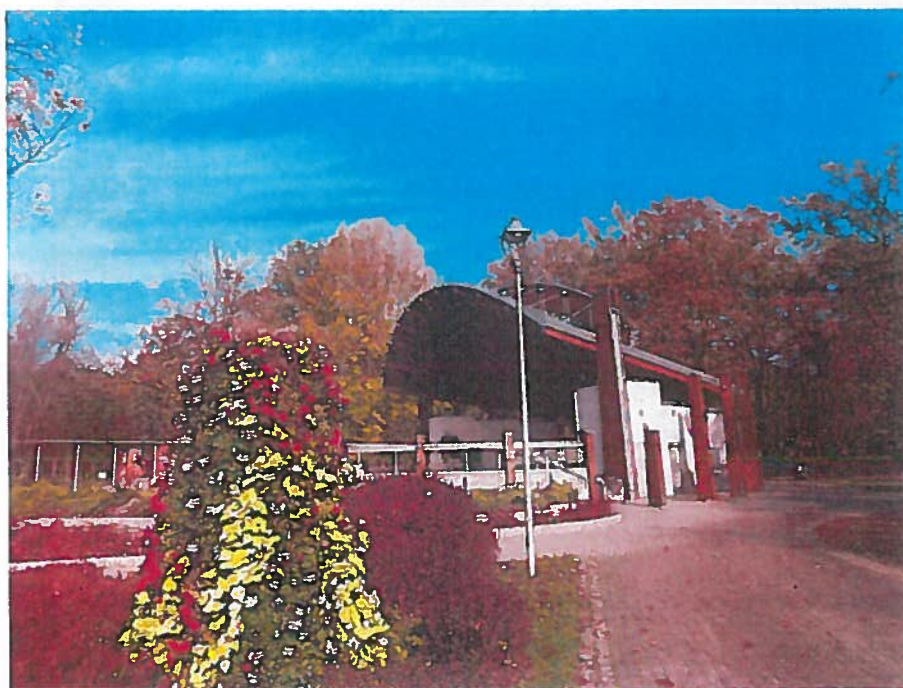
Rysunek 6. Amfiteatr w Parku Zdrojowym

Amfiteatr zlokalizowany jest w centralnej części Parku Zdrojowego między aleją główną a ul. Matejki. Obiekt został oddany do użytku całkiem niedawno – 20 kwietnia 2009 roku. Bryła amfiteatru oparta jest na planie koła o średnicy ponad 30 metrów. Na widowni znajduje się 306 miejsc siedzących oraz 14 stanowisk dla osób niepełnosprawnych poruszających się wózkami inwalidzkimi. Latem w amfiteatrze odbywają się liczne koncerty i imprezy. W porze zimowej naprzeciw amfiteatru działa sztuczne lodowisko.