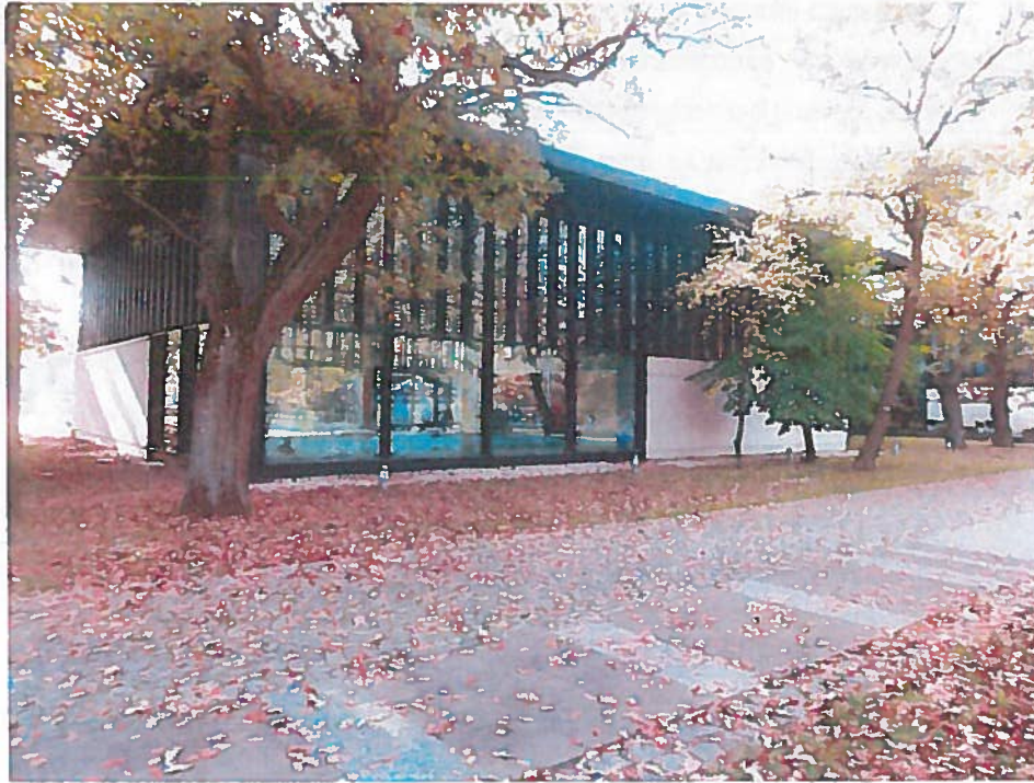
Rysunek 8. Basen solankowy w EVA Park Life & SPA