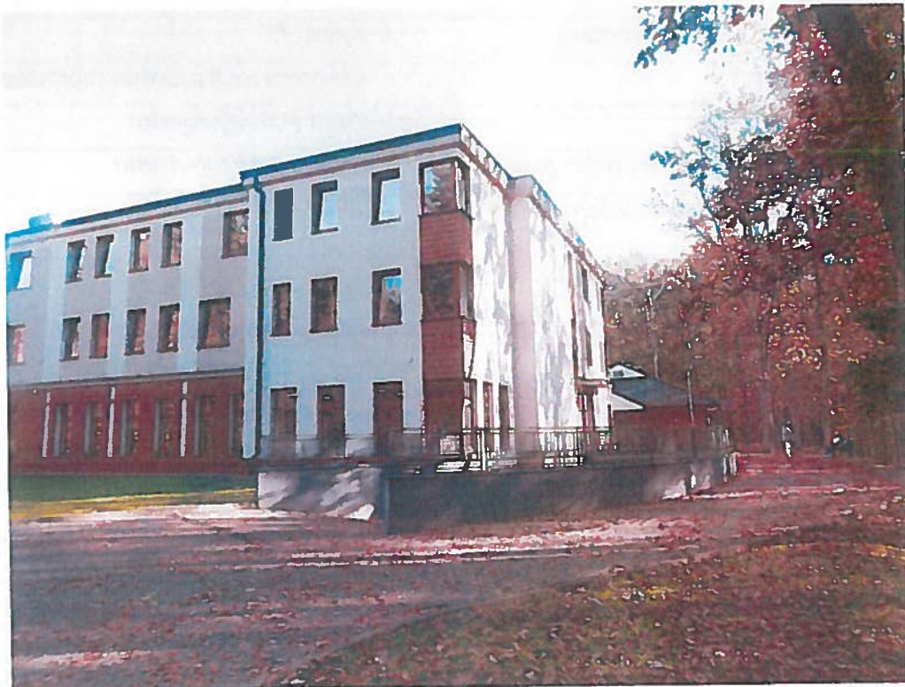
Rysunek 2 Zakład Rehabilitacji z Zakładem Przyrodolecznicy przy ul. Sue Ryder 1