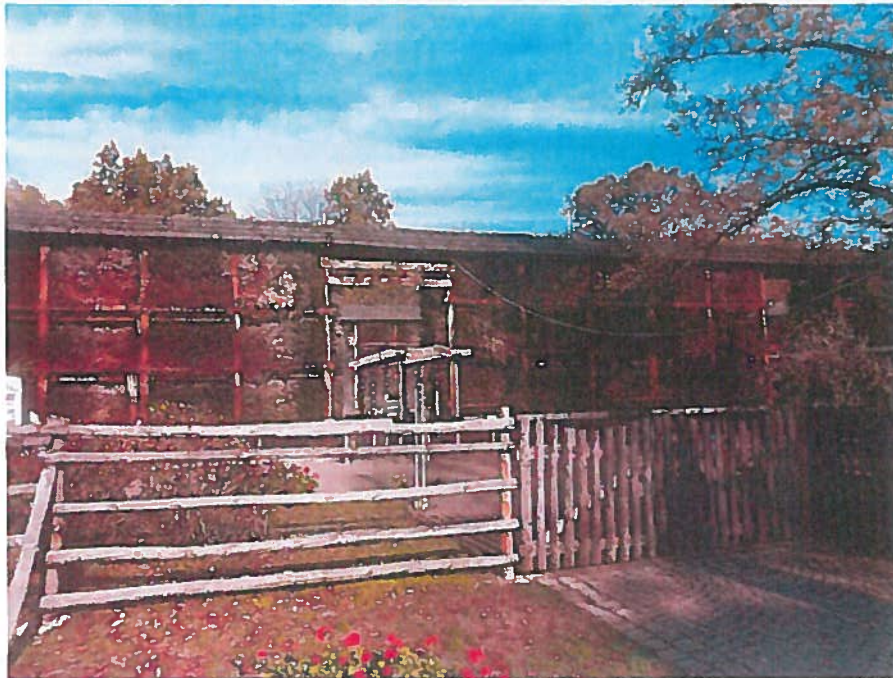
Rysunek 4. Konstancińska Tężnia

Tężnia solankowa Uzdrowiska Konstancin-Zdrój S.A. jest obiektem leczniczym – inhalatorium zewnętrznym. Została zbudowana w 1978 roku i jest zasilana solanką z położonego nieopodal odwiertu, która, dzięki stężeniu minerałów 6,5%, posiada właściwości lecznicze. Powietrze wokół Tężni w wyniku parowania solanki tworzy swoisty mikroklimat zbliżony do klimatu, którym możemy cieszyć się nad morzem. Minerale w nim zawarte wspomagają odbudowę i regenerację błony śluzowej górnych dróg oddechowych. Działają także stymulująco na pracę układu odpornościowego. Szczególnie istotne dla zdrowia są pierwiastki jod, brom, wapń oraz magnez. Solanka spływając po faszynie odparowuje i wytwarza swoisty mikroklimat, a dodatkowo rozbijana jest w sposób mechaniczny przez inhalator (grzybek) wytwarzający aerozol. Minerale i mikroelementy znajdujące się w solance wchłaniane są przez błony śluzowe dróg oddechowych i skórę uzupełniając niedobór tych mikroelementów w organizmie człowieka.