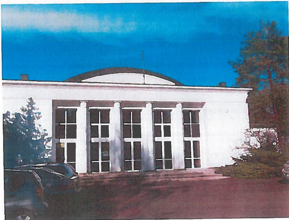
Rysunek 3. Centrum Terapii Narządu Ruchu "Biały Dom" - Zakład Przyrodoleczniczy

Ponadto na terenie Uzdrawiskowej Konstancin-Jeziorna działają zakłady lecznicze, które nie są wpisane do ewidencji Naczelnego Lekarza Uzdrawiska ale posiadają długą i bogatą tradycję w leczeniu schorzeń narządu ruchu i chorób reumatologicznych.