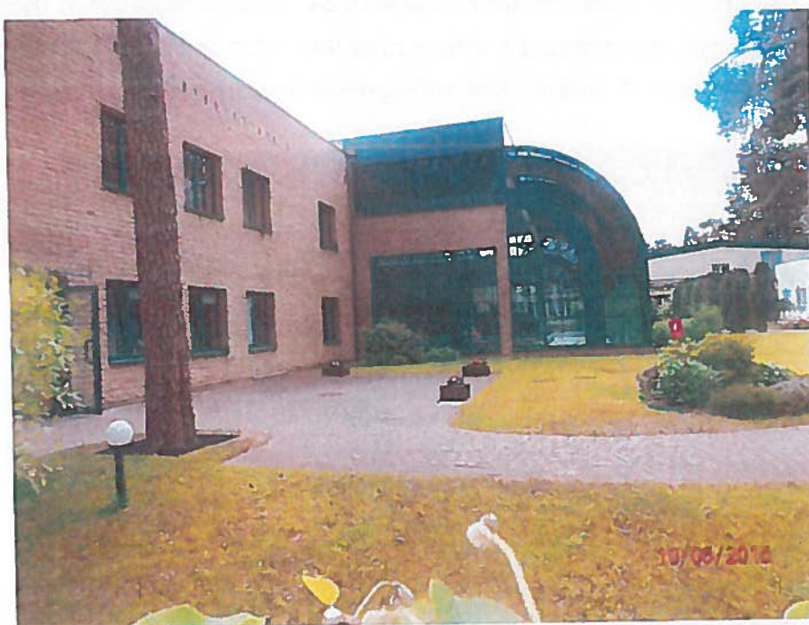
Rysunek 7. Basen Rehabilitacyjny w CKR Sp. z o. o.

Basen Rehabilitacyjny został oddany do eksploatacji 1 sierpnia 2003 roku. Eksploatacja basenu odbywa się w systemie ciągłym. Sposób eksploatacji basenu oraz sposób monitorowania jakości wody i powietrza hali basenowej określa instrukcja funkcjonalna opracowana dla basenu. Sposób korzystania z basenu określa regulamin. Pomieszczenia basenowe: Podzielone są na dwie strefy dla pacjentów w obuwiu oraz dla pacjentów bez obuwia. Oddzielnie pomieszczenia dla kobiet i mężczyzn w kolejności usytuowania jak poniżej:- przebieralnie wyposażone w szafki na ubrania w liczbie: męska dla 40 osób, damska dla 36 osób i koedukacyjna dla 20 osób, -pomieszczenia higieniczno-sanitarne, natryski: w części męskiej 5 szt., w części damskiej 5 szt., w części koedukacyjnej 1 natrysk, wc w części damskiej – 3 szt., wc w części męskiej-2 szt., w części koedukacyjnej 1 szt.