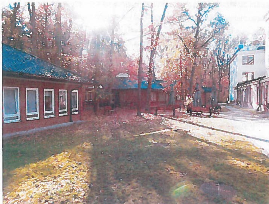
Rysunek 1. Szpital uzdrowski przy ul. Sue Ryder 1