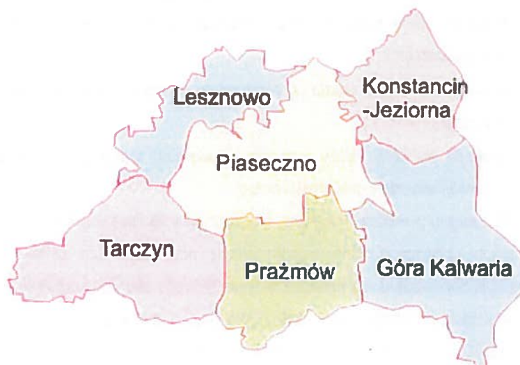
Rysunek 1. Położenie gminy Konstancin-Jeziorna na tle powiatu piaseczyńskiego

Gmina Konstancin-Jeziorna położona jest w centralnej części województwa mazowieckiego, w powiecie piaseczyńskim. Gmina należy do aglomeracji warszawskiej i tym samym od północnego-wschodu graniczy z miastem stołecznym Warszawa. Zachodnią granicą sąsiaduje z gminą Piaseczno, południową z gminą Góra Kalwaria, wschodnią natomiast wyznacza rzeka Wisła. Położenie gminy na tle powiatu piaseczyńskiego przedstawia poniższy rysunek.