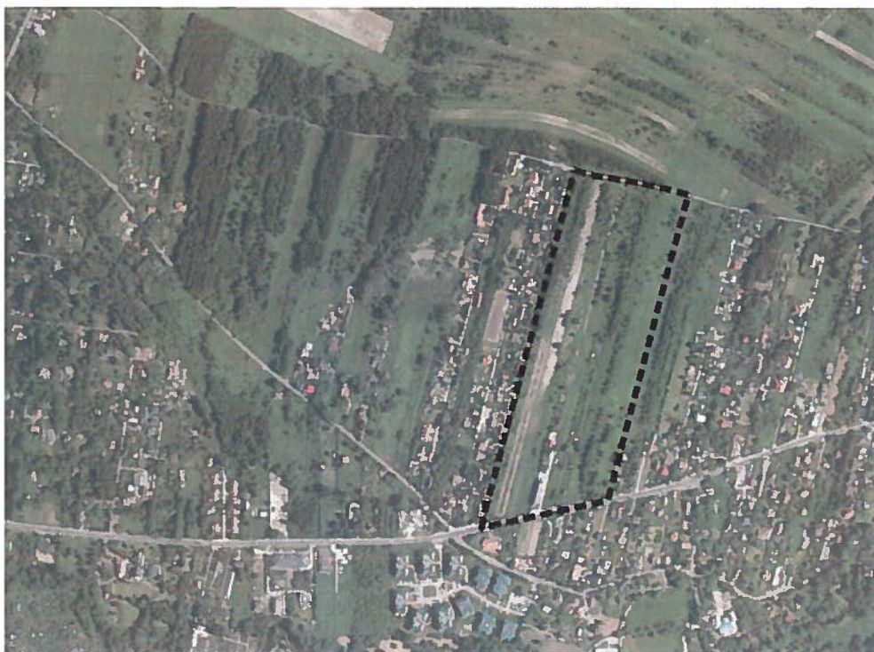
Rysunek 1 Obszar objęty opracowaniem

Cel i zakres miejscowego planu zagospodarowania przestrzennego określa ustawa z dnia 27 marca 2003 r. o planowaniu i zagospodarowaniu przestrzennym.