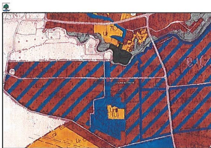
Rys. 3. Wyrys ze Studium uwarunkowań i kierunków zagospodarowania przestrzennego Miasta i Gminy Konstancin-Jeziorna

Zatem zgodnie z obowiązującym Studium dopuszcza się zabudowę mieszkalną przy zachowaniu 85 % powierzchni biologicznie czynnej. Niewątpliwie utrzymanie zabudowy mieszkaniowej jednorodzinnej na działce o nr ew, 40 z obrębu 03-04 jest uzasadnionym przypadkiem.