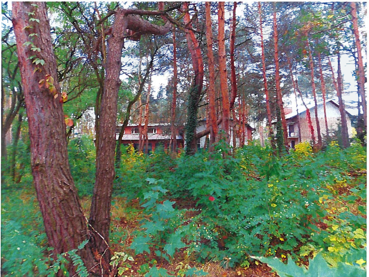
Rys. 1. Działka o nr ewid. 40 z obrębem 03-04