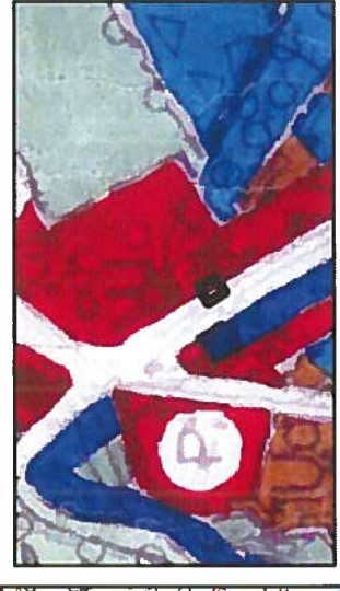
U - Teren usług "centrum miasta i gminy"

Wyrys ze Studium uwarunkowań i kierunków zagospodarowania przestrzennego Miasta i Gminy Konstancin-Jeziorna zatwierdzonego Uchwałą Nr 97/III/17/99 Rady Miejskiej Konstancin-Jeziorna z dnia 27 grudnia 1999 r.