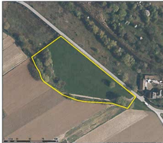
Rycina 1. Obszar opracowania miejscowego planu zagospodarowania przestrzennego dla działki o nr ewid. 122/1 z obrębu ewid. 00-17 Obórki w gminie Konstancin-Jeziorna na tle ortofotomapy z 2023 r.

Teren planu miejscowego znajduje się w granicach obszaru narażonego na niebezpieczeństwo powodzi.