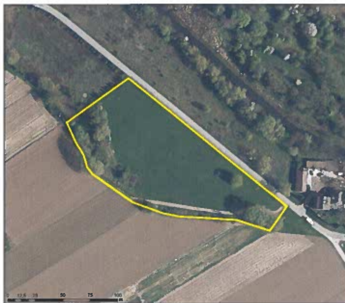
Rycina 1. Obszar opracowania miejscowego planu zagospodarowania przestrzennego dla działki o nr ewid. 122/1 z obrębu ewid. 00-17 Obórki w gminie Konstancin-Jeziorna na tle ortofotomapy z 2023 r.

Teren planu miejscowego znajduje się w granicach obszaru narażonego na niebezpieczeństwo powodzi.