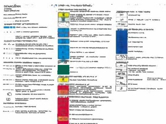
Rycina 3. Obszar opracowania na tle studium uwarunkowań i kierunków zagospodarowania gminy.

Projekt miejscowego planu zagospodarowania przestrzennego uwzględnia cele i kierunki zawarte w Studium uwarunkowań i kierunków zagospodarowania przestrzennego miasta i gminy Konstancin-Jeziorna przyjętym Uchwałą Nr 97/III/17/99 Rady Miejskiej Konstancin-Jeziorna z dnia 27 grudnia 1999 r. Obszar objęty miejscowym planem zagospodarowania przestrzennego w Studium znajduje się w części strefie ochrony ekologicznej 2E obejmującej tereny obniżen pradolinnych i starorzeczy w obrębie terasy zalewowej i nadzalewowej rzeki Wisły, w tym dolina rzeki Jeziorki, z wodami i zielenią – w większości w granicach obszaru chronionego krajobrazu oraz w części w strefie ochrony wartości rolniczych – R (rycina 3).