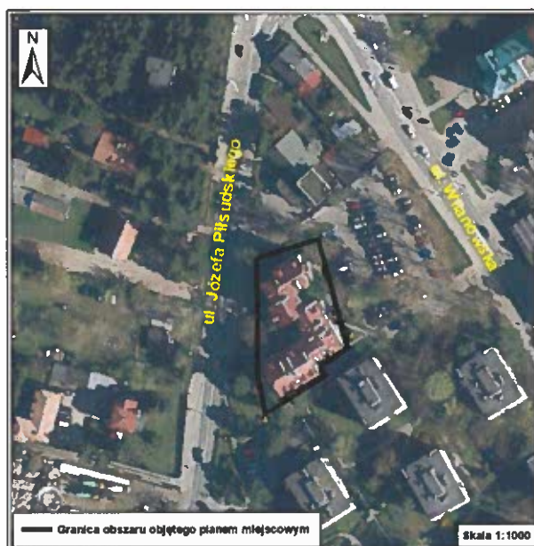
Rysunek 1. Obszar opracowania miejscowego planu zagospodarowania przestrzennego dla działki o nr ew. 39/30 z obrębu 03-12 w Konstancinie-Jeziornie, na tle ortofotomapy z 2023 r.

Analizowany obszar znajduje się poza granicami obszaru narażonego na zalanie w przypadku zniszczenia lub uszkodzenia wału przeciwpowodziowego.