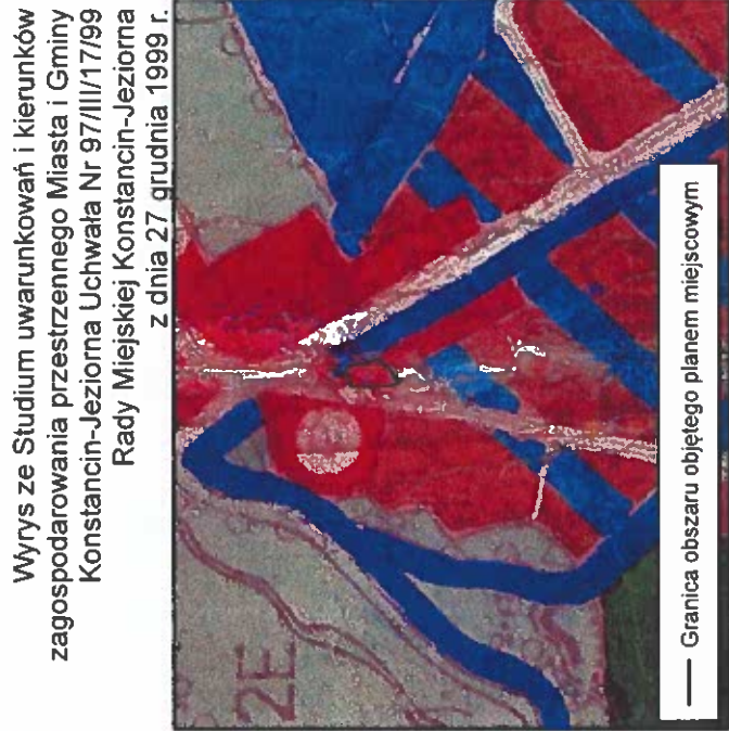
Skala 1:10 000